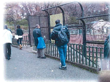
↑おおっと、キリン発見。