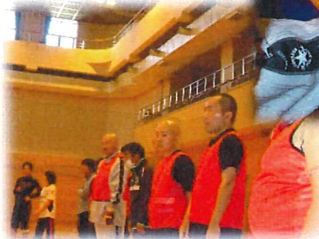
←相州ジャパン整列

ご参加いただいた愛光病院様、エアリアル様、相州メンタルクリニック様 ありがとうございました。そしてまた交流しましょう！