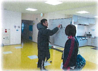
↑まずはルールを確認

毎週金曜午後に活動している「スポーツ」プログラムの拡大版として、日ごろ取り組んでいるスポーツで他所と 交流したい！ というメンバーの希望により実現したこの企画、第一回目はフットサルです。